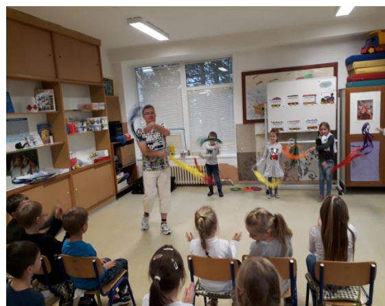
Knick Knack - interaktívna pohybová aktivita pre deti